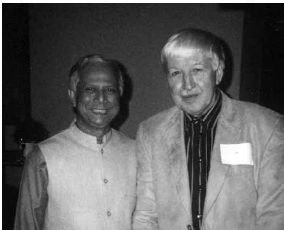
Muhammad Yunus og forfatteren i København 2006

Mikrokredit har således placeret sig solidt på banen, når det gælder udvikling i den 3. verden. Mikrokredit er kommet for at blive, for at ekspandere, og for til stadighed at tilpasse sig tiden og stedet i hvilken det virker.