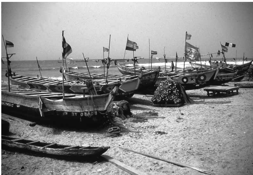
Både til kystfiskeri i Ghana finansieret af mikrokredit

Diskussionen kompliceres yderligere af, at business-skolen vil argumentere, at med mindre en MFI begynder at give overskud har den ingen fremtid. Hvis den afhænger af donorpenge, er den dødsdømt når donorernes pengestrøm slipper op. Så hvis man ser på mikrokredit som en forretning, så spring de ædle motiver over (delvis) og driv det som en forretning.