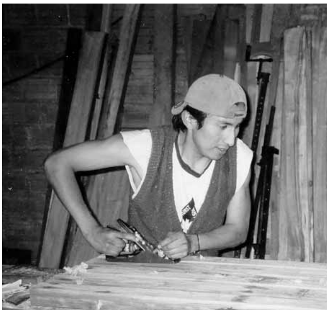
Mikrolån til værktøj og varelager i Bolivia

At finde den balance er ikke nemt, og der er til stadighed en fare for at 'de der finansierer det' sætter rammerne for 'de der udfylder det' på bekostning af 'de der behøver det'.