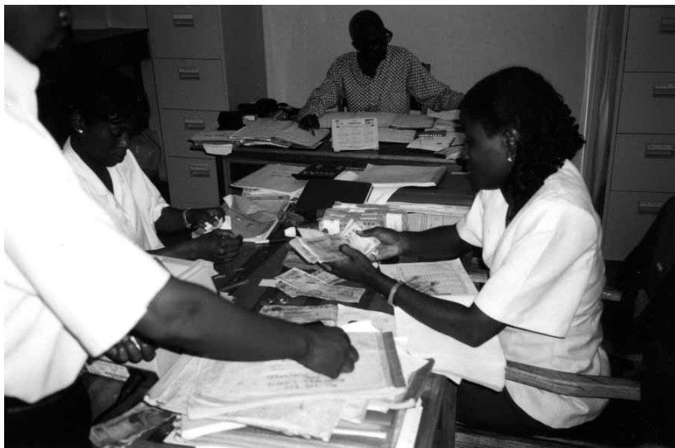
Afregning af mikrolån i Tema, Ghana

Forholdet mellem en MFI og kunden er – i modsætning til gavebistand – et gensidigt forhold, hvor de to parter er afhængige af hinanden. Uden lån ingen fremtid for klienten. Uden tilbagebetaling ingen fremtid for MFIen. Anderledes med gavebistand, hvor angsten for at donoren vælger at standse bistanden altid er til stede.