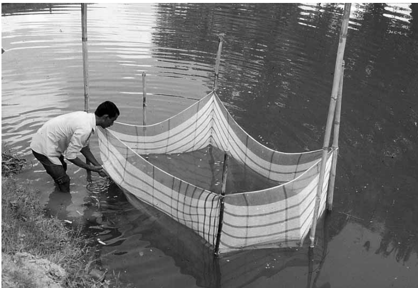
Mikrolån til fiskedamme Bangladesh