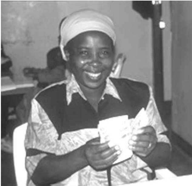
For Gladys fra Jamii Bora i Kenya er et mikrolån et værktøj til en bedre fremtid